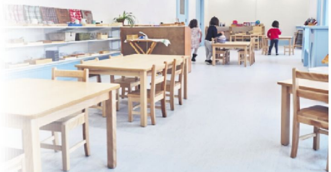
D'une capacité de 80 places, la garderie ouvrira ses portes en janvier prochain.

Pour plus d'information : www.lavillamontessori-quebec.ca .